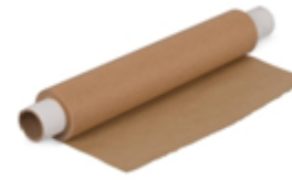
papier do pieczenia