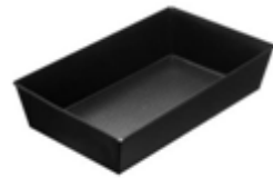
forma do pieczenia