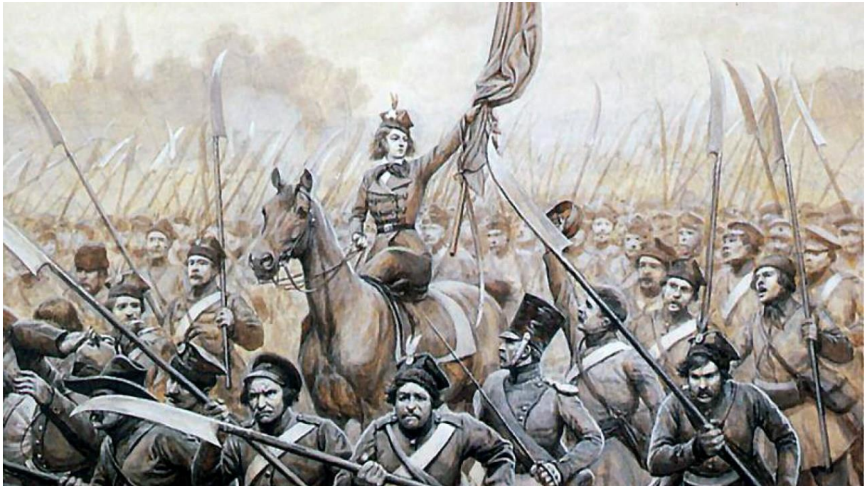
Jan Rosen Emilia Plater na czele kosynierów